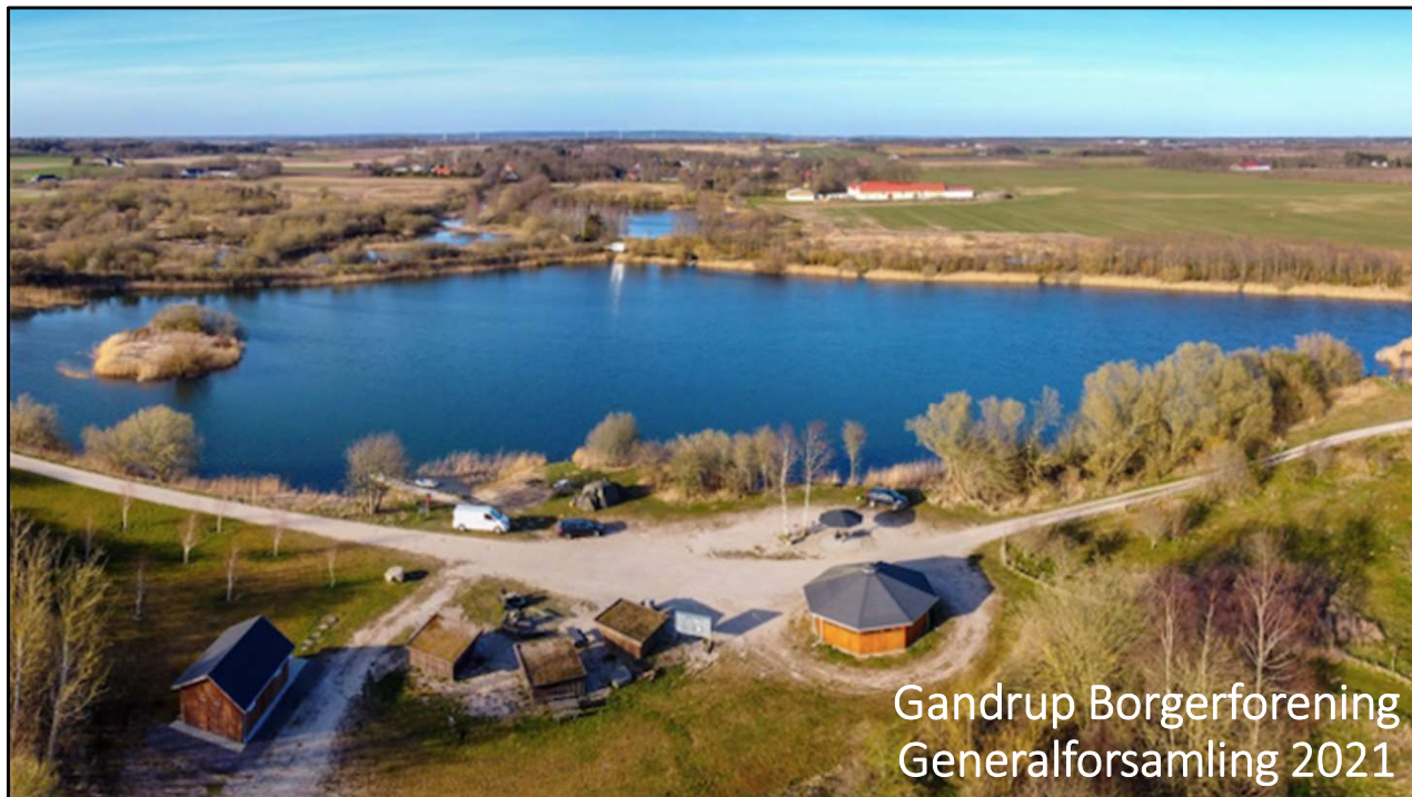
Gandrup Borgerforening Generalforsamling 2021