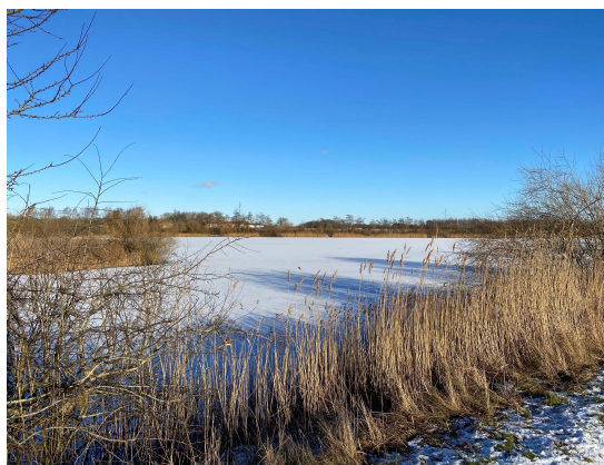
Is på Teglværkssøerne januar 2021